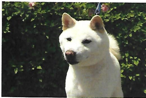
りき オス 推定2-4歳