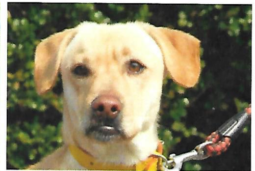
えこ助 オス 推定1-3歳