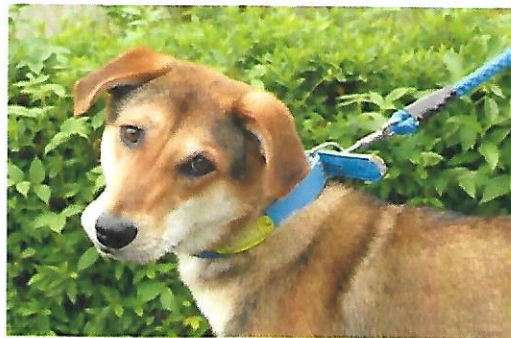
伊右衛門 オス 推定1-3歳